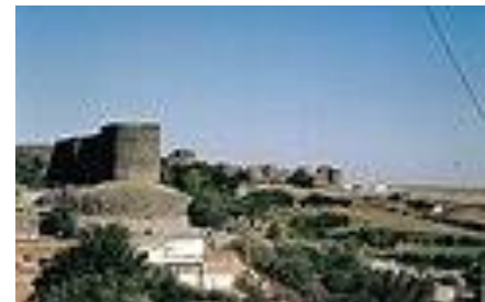
دیواره‌کانی شاری ئامهد