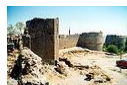
دیواره‌کانی شاری ئامهد