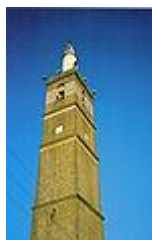
مزگه‌وته‌ی جه‌ماعه‌تی سه‌ده‌ی ۱۲