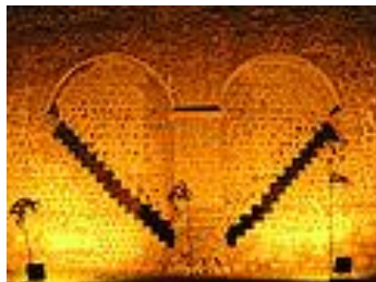
به‌شیک له دیواری کۆنی شاری ئامهد

دیواره‌کانی قه‌لایه‌که، له‌دوای دیواری چین به‌رزترین و درێژترین دیواری به‌دوای یه‌که‌وه‌ن له‌ئاستی جیهان. قه‌لایه‌که چهند ده‌روازه‌یه‌کی هه‌یه، سه‌ره‌کییه‌که‌یان ناوی چیا داگ، ده‌روازه‌ی ئورفه، ده‌روازه‌ی ماردین و ده‌روازه‌ی نوێ یینی.